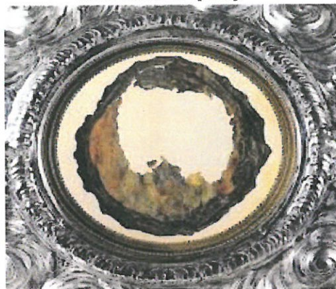
MIRACOLO EUCARISTICO LANCIANO (CH)